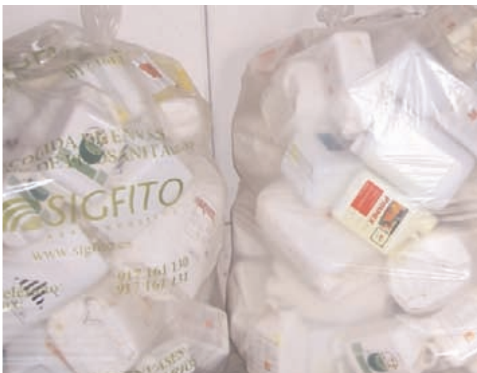
En las sacas sólo se deben depositar los envases vacíos y que estén marcados con el logo de SIGFITO

Los Centros de Agrupamientos, agricultores, y demás agentes implicados están comprendiendo el mensaje de SIGFITO. Gracias al esfuerzo de todos, el SIG continúa con su labor de recogida en beneficio de la agricultura y el medio ambiente. Por eso, desde SIGFITO pedimos la colaboración de todos para poder seguir un año más trabajando por un campo más limpio.