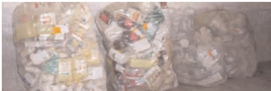
Los envases deben estar bien acondicionados en las bolsas para su recogida

La colaboración de los Centros de Agrupamiento de SIGFITO ha sido y es fundamental para el SIG. Sin su participación no habría sido posible haber recogido los envases vacíos de fitosanitarios. Los puntos de recogida de SIGFITO han realizado una labor importante a largo de estos años, no sólo permitiendo al agricultor que deposite los envases de fitosanitarios en sus instalaciones -normalmente se entregan vacíos donde se han comprado- si no también ayudando a controlar que en las sacas no se entreguen otros residuos que no sean los marcados con el logo de SIGFITO.